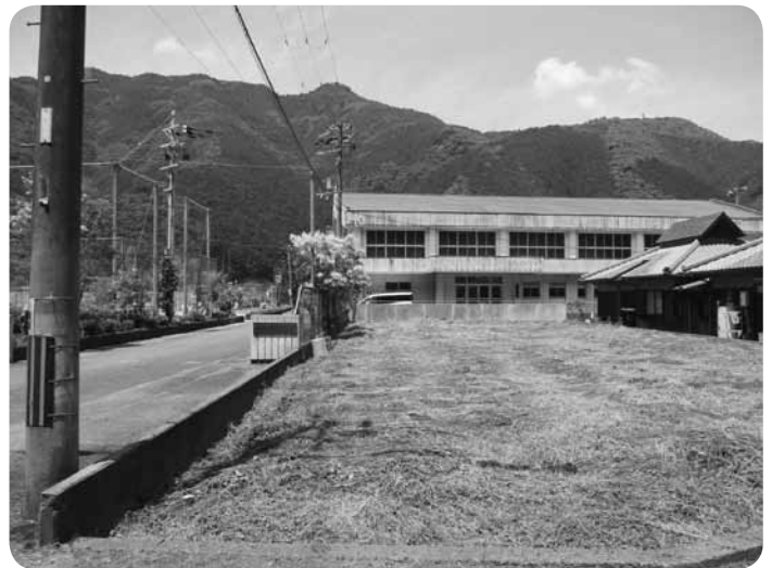
川原河小学校のバスターミナル兼駐車場予定地