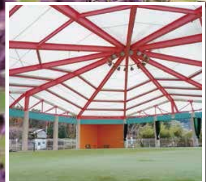
休憩所 (みやまドーム)