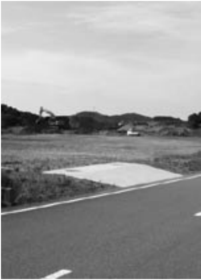
早蘇中学校前町有地