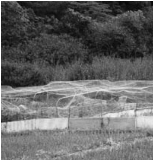
みかん畑に設置されたフワフワネット

た業者はあるのか。路線 延長の計画はあるのか。 答 町内9業者により 適正に入札が行われた。 最低制限価格を下回つ た業者はない。本事業で の路線延長計画もない。