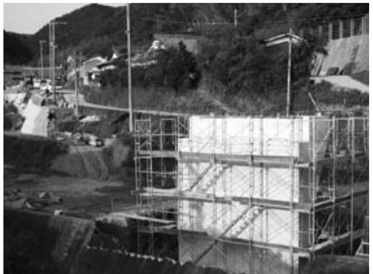
向山野集落道改良工事

業、子育て応援特別手当交付金事業、川辺西小学校敷地内にある学童保育室の改修工事、船津の岡本地区パイプライン整備工事、ホタルの里看板立て換え、上初湯川簡易給水施設整備事業に係る全体設計費と一部工事費、21年度普通交付税等の額の決定による一般財源からの財政調整基金等へ