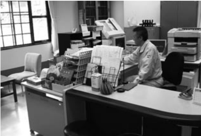
役場寒川出張所が移転した診療所事務室