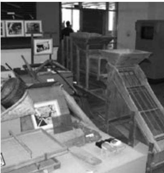
美山歴史民俗資料館内部

問 本町には中津郷土文化保存伝習館、美山歴史民俗資料館の2つの民俗資料館がある。2つの資料館の利用状況は。 新町となって、2つの民俗資料館の位置付けがより重要となる。歴史、文化をテーマにした催しと連携した資料館の利用などを企画する考えは。 答 20年度、美山歴史民俗資料館では、27