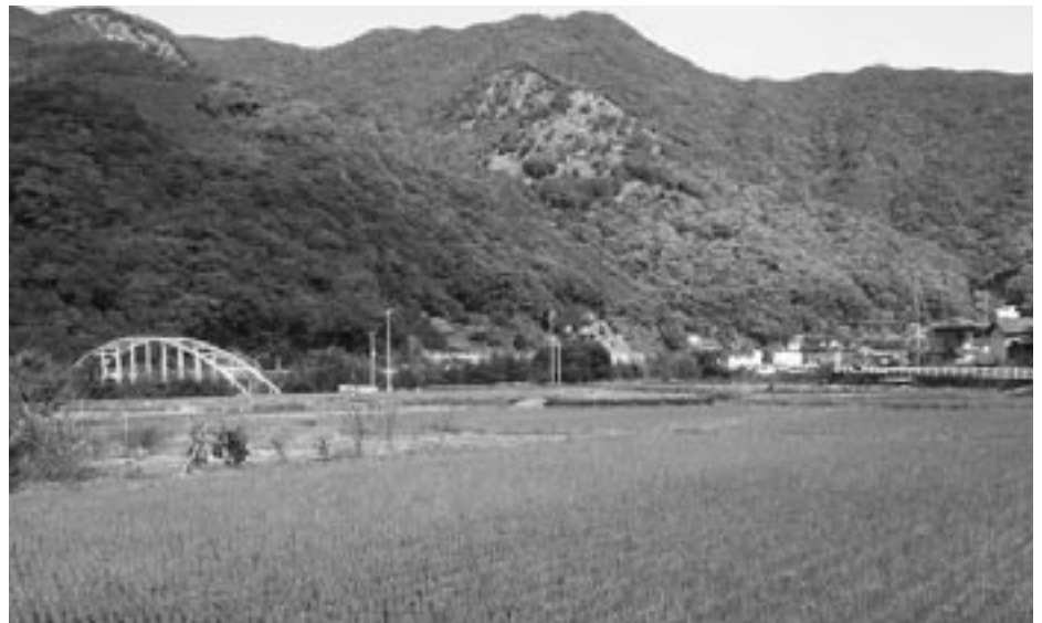
パイプライン工事が実施される岡本地区

答 非常に厳しい状況の中、単年度で考えるのではなく、財政調整基金、減債基金に蓄えておき、長期的な財政状況を