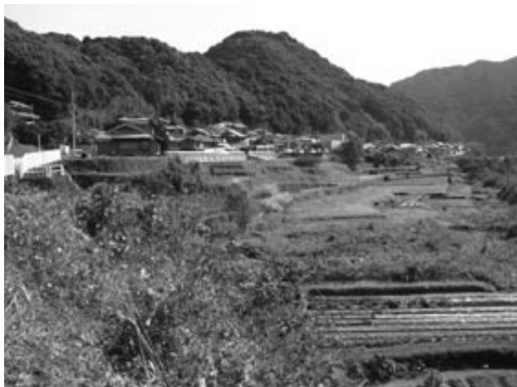
県道の船津地区改修予定地

観音寺橋上流から滝本橋まで850は、全体工事費概算で約6億円程度必要。平成20年度に測量設計業務が実施され、今年度中に用地の買収が完了する見込みである。すでに1億円を消化しているが、県では現時点で平成24年度完成を目標としている。