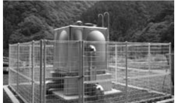
小薮川簡易給水施設

予算総額に327万6 千円を追加し、補正後の 額を777万6千円とす るものです。