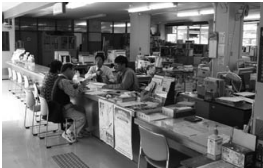
役場中津支所窓口

だけでなく、行政課題の大部分に対応できる支所にするということだが、具体的にどうするのか。 若手の職員配置という町長の考えもあるようだが、地域住民の生活を熟知したベテランも入れた体制が必要と考える。今まで弱かった支所長や課長の決裁権の強化も必要だ。