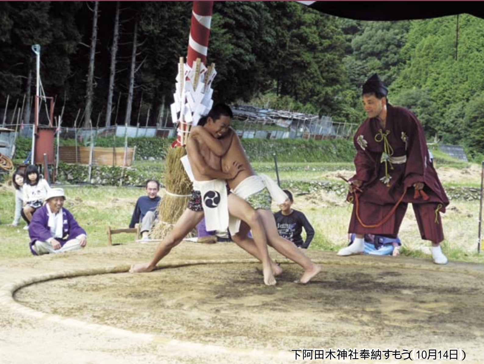
下阿田木神社奉納すもゝ(10月14日)

住所 和歌山県日高郡日高川町土生160番地 TEL. 0738 - 22 - 9504 FAX. 0738 - 22 - 2093 E-mail: gikai@town.hidakagawa.lg.jp