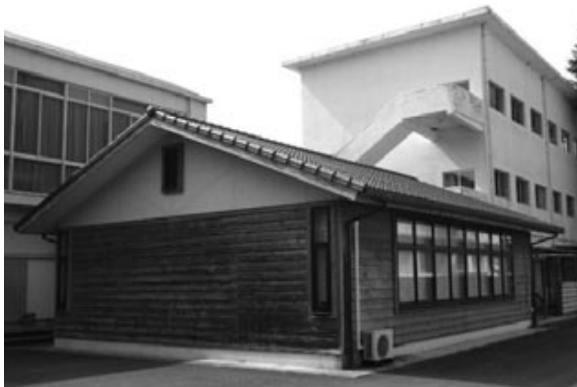
旧船着中学校コンピューター室

となる。 このような状況のなか、川辺西小学校でモデル的に始めた学童保育が4名から33名に増加。国庫補助を利用し、改修工事を予定している。 さらに子育て支援が町の未来に繋がるという視点から、平成22年にお