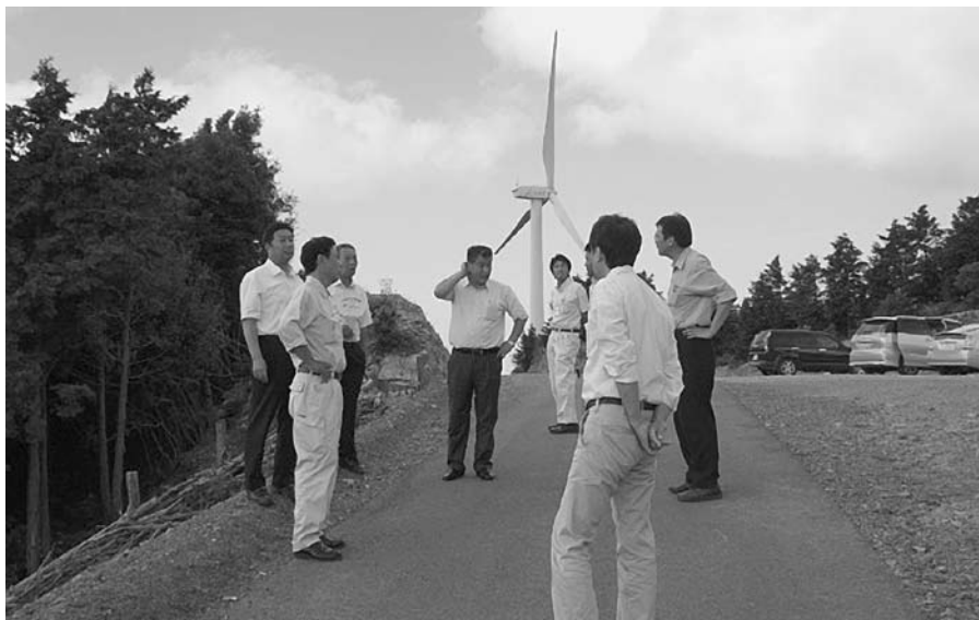
白馬ウインドファーム

識を一層深めました。当路線は、日高川町の第二幹線軸として、最重の要望事項と位置付けられています。今後も工事が途切れることがないように、全線の早期完成に向けて、要望活動を続けていきます。