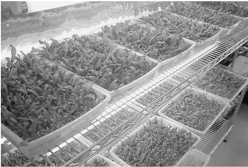
バイオセンター中津