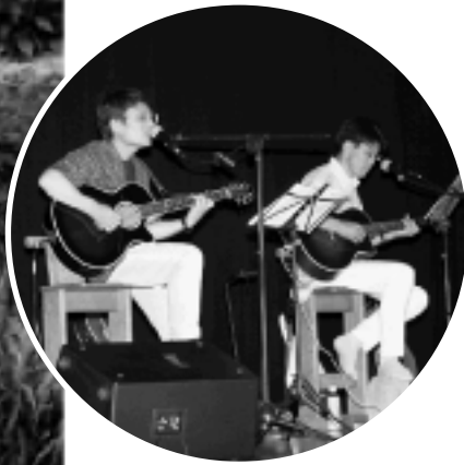
姫風のコンサート