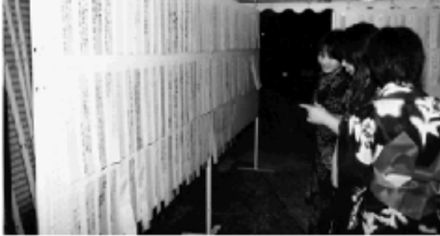
「ホタルの歌会」展示