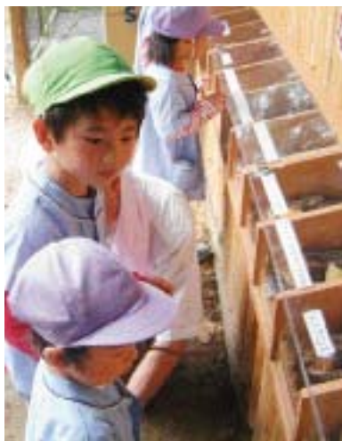
展示コーナーでは世界の珍しいカブト虫とクワガタ虫が