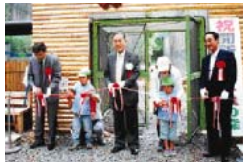
開所式でのテープカット