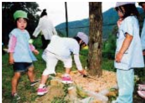
ここにあったよー