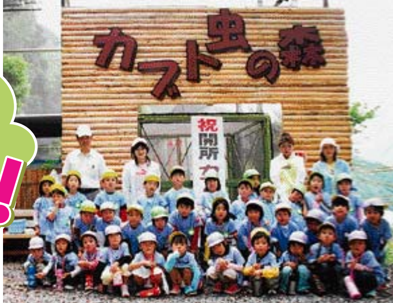
記念撮影（なかつ保育所園児）

7月1日、高津尾地内に「カブト虫の森」がオープンしました。第二鳴滝キャンプ場の近くで、広さ360平方メートルにドングリの木を植え、カブト虫の生息に適した環境にしています。園内にはカブト虫を放しており自由に捕まえることができます。カブト虫の幼虫は、4月頃から「中津のカブト虫グループ」のメンバーやボランティアの人たちが中津地区で探して飼育してきました。今人気の「ムシキング」に出てくるカブト虫やクワガタの展示もあり、多くの観光客や親子連れでにぎわっています。