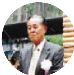
笹町長のあいさつ