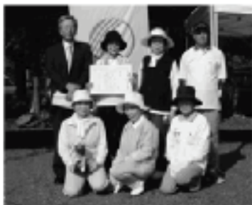
▲優勝した明神チーム