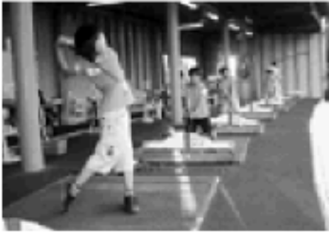
「初心者ゴルフ体験教室」では30の方が参加。