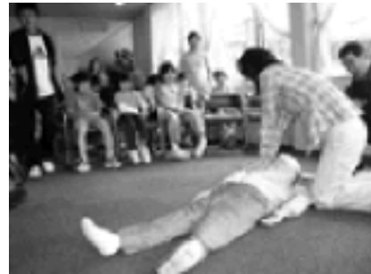
万一の怪我と、来たる遊泳シーズンに備えて、「応急手当・救急救命講習」も実施