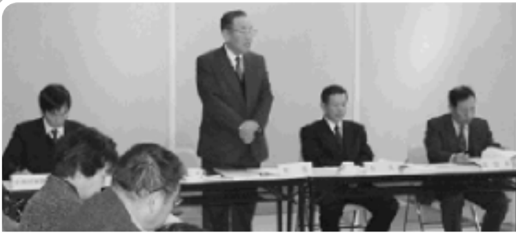
▲川辺地区地域審議会