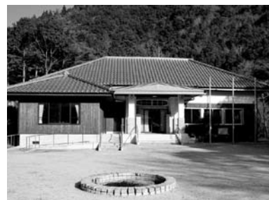
▲上初湯川ふれあいの家

また、集落より更に龍神方面に向かうと八斗蒔 はちとうまき があり、秋には紅葉の名所として多くの人が訪れます。