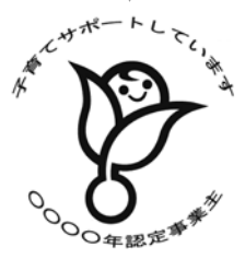
(認定マーク) くるみん