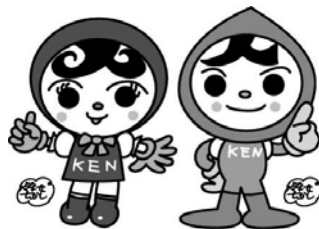
人権イメージキャラクター 人KENあゆみちゃん 人KENまもる君

人権に関する困りごと 心配ごとのご相談は お近くの法務局や 人権擁護委員へ ご相談ください。