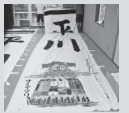
新調された五反絵幟(平川区)