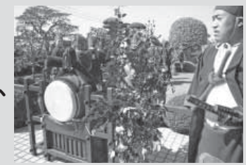
新調された太鼓と太鼓台と奴衣装(小熊区)

宝くじの社会貢献広報事業により平川区の四つ太鼓の天幕や幟8本、太鼓、同じく小熊区の太鼓と太鼓台や奴衣装が新調されました。