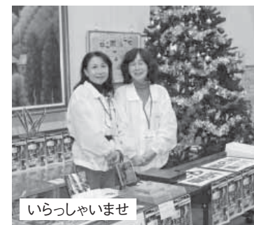
いらっしゃいませ