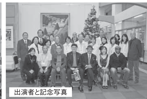
出演者と記念写真