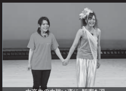
中高生の力強い姿に、観客も涙