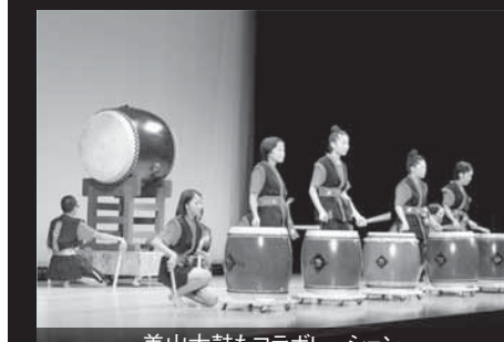
美山太鼓もコラボレーション

日高川町と友好都市・大阪狭山市の中高生による、両市町の絆を結ぶ物語「ふたりのひとつ星」が8月18日に日高川交流センターで行われ、110人の出演者によるダンスパフォーマンスや美山太鼓とのコラボレーションで満員の観客を魅了しました。