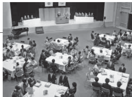
平成24年日高川町成人式の様子