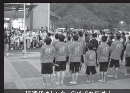
終演後はセンターの外でお見送り