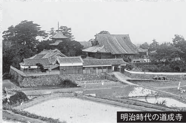
明治時代の道成寺