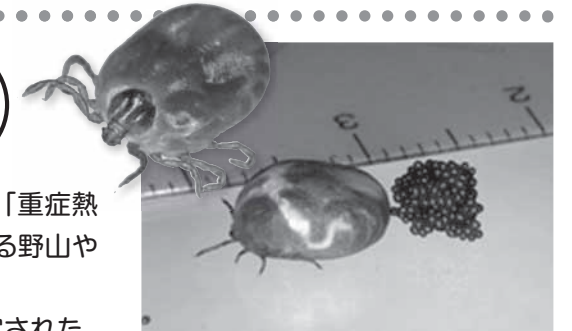
フタゲチマダニ 保健福祉課

「重症熱性血小板減少症候群(SFTS)」とは、2011年に初めて特定された、新しいウイルス(SFTSウイルス)に感染することによって引き起こされる病気です。主な症状は発熱と消化器症状で、重症化することもあります。