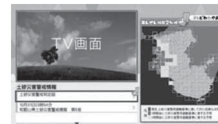
テレビわかやま地上デジタルデータ放送