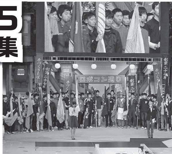
▲平成26年度会場の様子

若い高専生達が、既成概念にとらわれず自らの頭で考え、自らの手でロボットを作り、操縦します。たくさんの工夫を凝らしたロボットが競技に挑戦するロボットコンテストを観覧してみませんか。