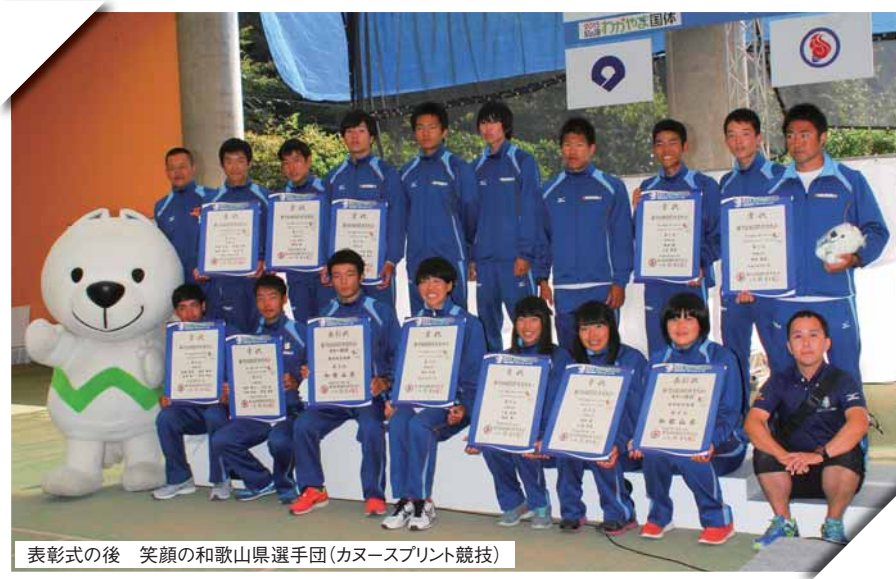
表彰式の後 笑顔の和歌山県選手団(カヌースプリント競技)