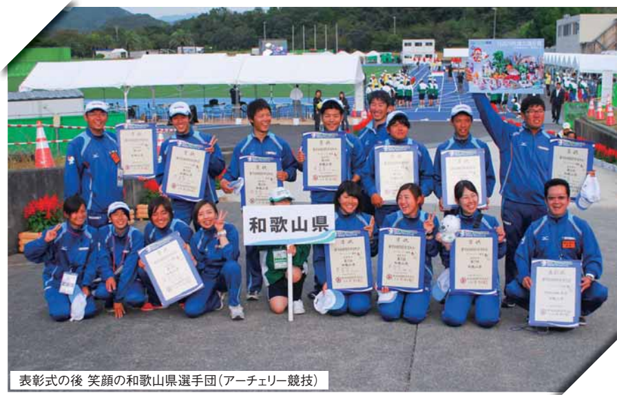
表彰式の後 笑顔の和歌山県選手団(アーチエリー競技)

日高川町では、9月27日～29日と10月1日～4日の計7日間にわたる紀の国わかやま国体アーチエリー競技会およびカヌースプリント競技会が開催されました。多くの皆さまのご声援もいただき、アーチエリー競技、カヌースプリント競技ともに、和歌山県選手団は総合成績で3位、カヌースプリント競技では女子総合成績6位と優秀な成績をおさめられました。