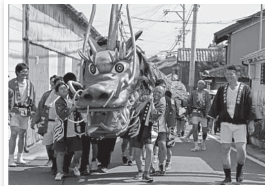
昨年の金賞作品『重いよ〜』

友好都市大阪狭山市と日高川町の若者が共に築きあげた始まりの舞台「ふたりのひとつ星」、日高川町の伝統や文化を題材とした感動舞台「絆の星 鼓動響く清流の地より」から2年、再びここ日高川交流センターで公演することになりました。つきましては、この舞台に出演、協力していただける児童・生徒の皆さんの募集を行います。みんなで作り上げる感動の舞台を一緒に体験しませんか。是非ご参加ください。