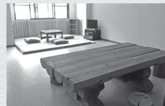
談話室(共有スペース)