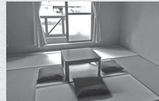
家具備え付けの個室

また、移住を決断するきっかけとして、地域との「ご縁」はとても大切です。縁もゆかりもない土地に移住するのは不安ですが、そこに一人か二人でも仲のいい人ができれば、移住のハードルはぐっと下がります。これまでも遠方から移住者の方々を迎える際は、近隣の皆様に心温まるご協力をいただきました。「お試し移住施設」も、そういった「ご縁」や「出会い」のきっかけになるような活用ができればと考えています。