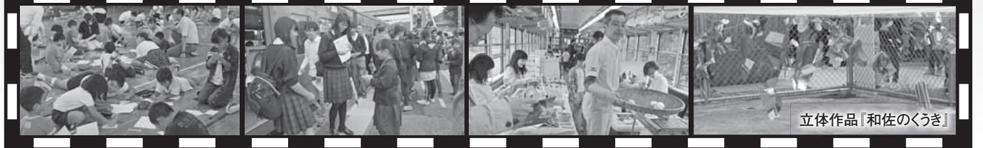
立体作品「和佐のくうき」