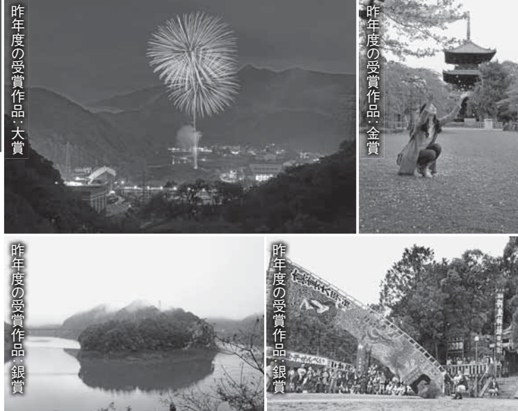
昨年度の受賞作品:大賞