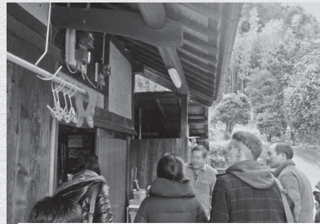
イベントでの空き家案内の様子

町内に空き家をお持ちでしたら、まずはお気軽に定住促進室へご連絡ください。引き続き、ご協力をお願いします。