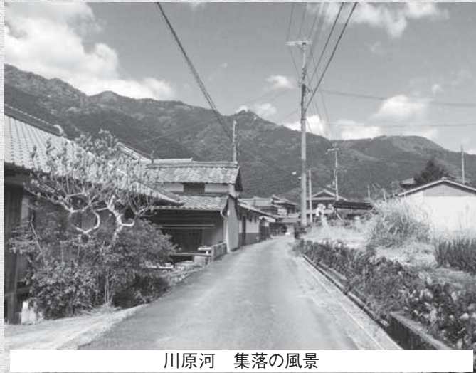
川原河 集落の風景

私は日高川町が、人口が少なくなった将来においても、幸せに暮らせる町であってほしいと思います。どうすればそれが実現できるのか、皆さんと知恵を出し合って模索していきたいです。