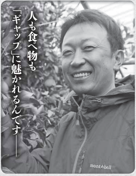
人も食べ物も「ギャップ」に魅かれるんです