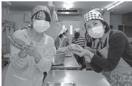
女性大学ヴィーナス コンニャクづくり

女性会活動は、女性会全体の活動とブロック活動を主な活動としてしています。全体では「花リンピック」、「くいのちフェスティバル」、「県下一斉クリーンウォーク」などを行っており、ブロック活動では、3月の卒業シーズンに町内の小中学生に女性会が中心となってフラワールレンジメント教室を開催したり、