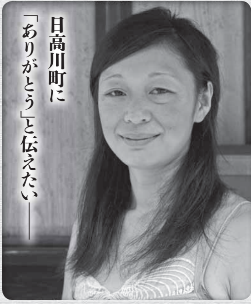
日高川町に「ありがとう」と伝えたい