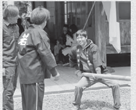
上阿田木神社祭りに参加した様子

皆様から教えて頂いた情報や経験を活かして協力隊活動をいかに進めていくか考え、地域の活性化に繋げていきたいです。また、協力隊任期終了後を見据えて、この地域で自分に何ができるのか良く考え、その為の準備を行っていければと考えております。