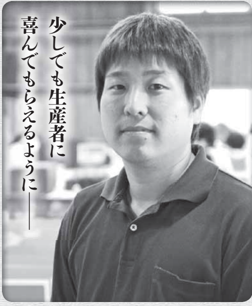
少しでも生産者に 喜んでもらえるように