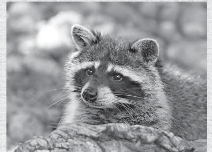
アライグマ(かわいいけど...)

また、アライグマと同じようにハクビシンの生息数も激増しているので注意が必要です。