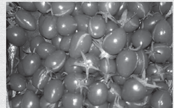
捨てるなんてとんでもない!(割れトマト)

です。つまり、農を「健康で心を豊かにしてくれるもの」と考えていたのです。この考え自体は、実際に作業をしてきた今でも変わってはいません。こんな例えをするとオーナーから怒られてしまいそうですが、僕はお手伝い作業を「健康を維持するためのフィットネス感覚」で捉えています。勿論、仕事なので好き勝手な事は出来ませんが、基本的には人を相手としない単純作業の繰り返しなのでストレスとは無縁です。「体を動かせる・お小遣いが貰える・売り物にならない収穫物がもらえる」という条件のフィットネスは都会にはないはずですが、僕の場合は、地域おこし協力隊という看板があるおかげでお手伝いをする機会にも恵まれたわけですが、なんの看板も持たない移住者であっても「農」と関わりたいと考えている人はいるはずですが、そういった人を上手く「農」に取り込む事でWin-Winの関係を築けるのではないかと思います。