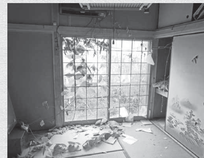
当該空き家の屋内の様子

こういった事と平行して、移住相談を受ける業務を行っています。私と同じように自身で空き家の改修をしてみたいと思う人は少なからず居ます。賃貸契約の場合は、DIYの可否など契約時に調整しないといけない点がありますが、出来る限り日高川町に人が来てほしいと思っているので、そういった方の受け皿となるような空き家を日々募集しています。空き家の扱いに困っている方や、空き家をお持ちで移住者を応援したいと思っている方は、下記までご相談ください。