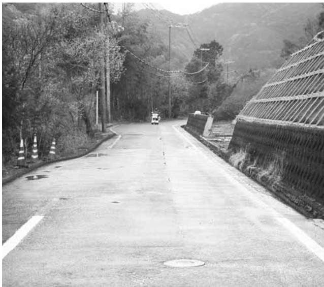
改修がすすむ町道大又岡本線