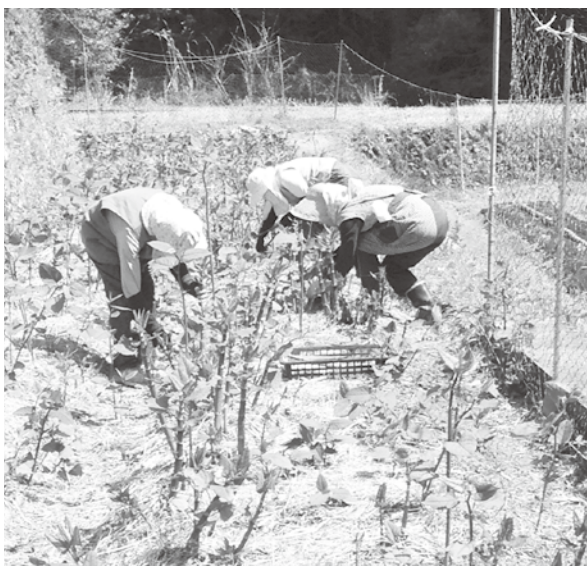
植栽がすすむイタドリ

【答】 企業誘致は雇用機会の創出や、地域経済の活性化、税収の拡大など町の活性化に大きく寄与するものであり、積極的に推進すべき課題である。 現在、県の企業立地課と連携を図りながら誘致活動に取り組んでいる。また、本町に出している企業と定期的に情報交換をしながら、新たな企業の誘致に努めている。