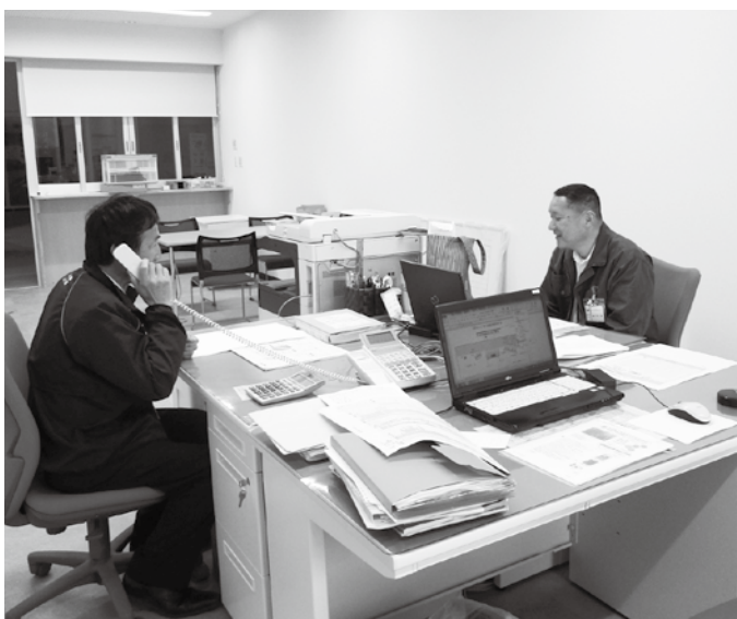
防災センター事務室

答 広場につながる道路は決して狭くないので、アクセスには問題ない。 備蓄の考え方は、支援物資が届く迄の3日間を想定している。食料・水・毛布等約6千人分を備蓄している。 センターの防災的な使用は無料であるが、それ以外は町民であっても有料となる。