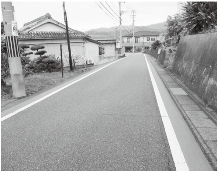
小熊地内のグリーンベルト

だ。どのように考えているのか。 工事関係の車両が多く通る通学路のより一層の対策を問う。 歩道がない箇所へのグリーンベルトの設置やガードレール等の現状の確認を早急にし、より一層の安全対策を