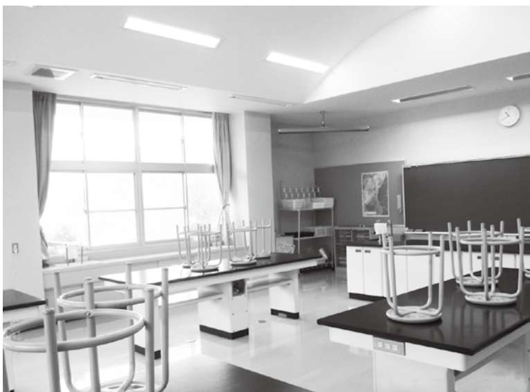
空調が設置される中学校の理科室