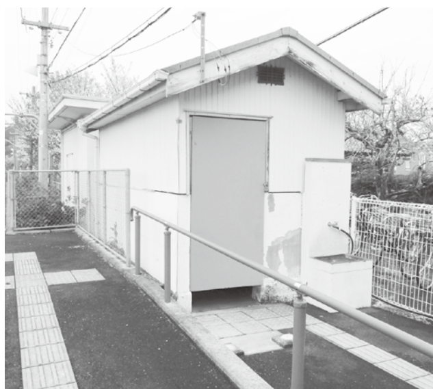
使用できない道成寺駅のトイレ

問 平成28年9月議会で市木前町長は、道成寺駅のトイレ整備について、JR西日本と御坊市に働きかけを行