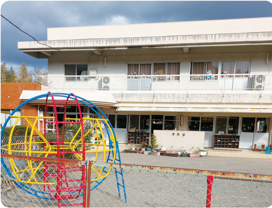
さくらんぼ保育所

●日高川町乳児等通園支援事業の設備及び運営に関する基準を定める条例の制定について