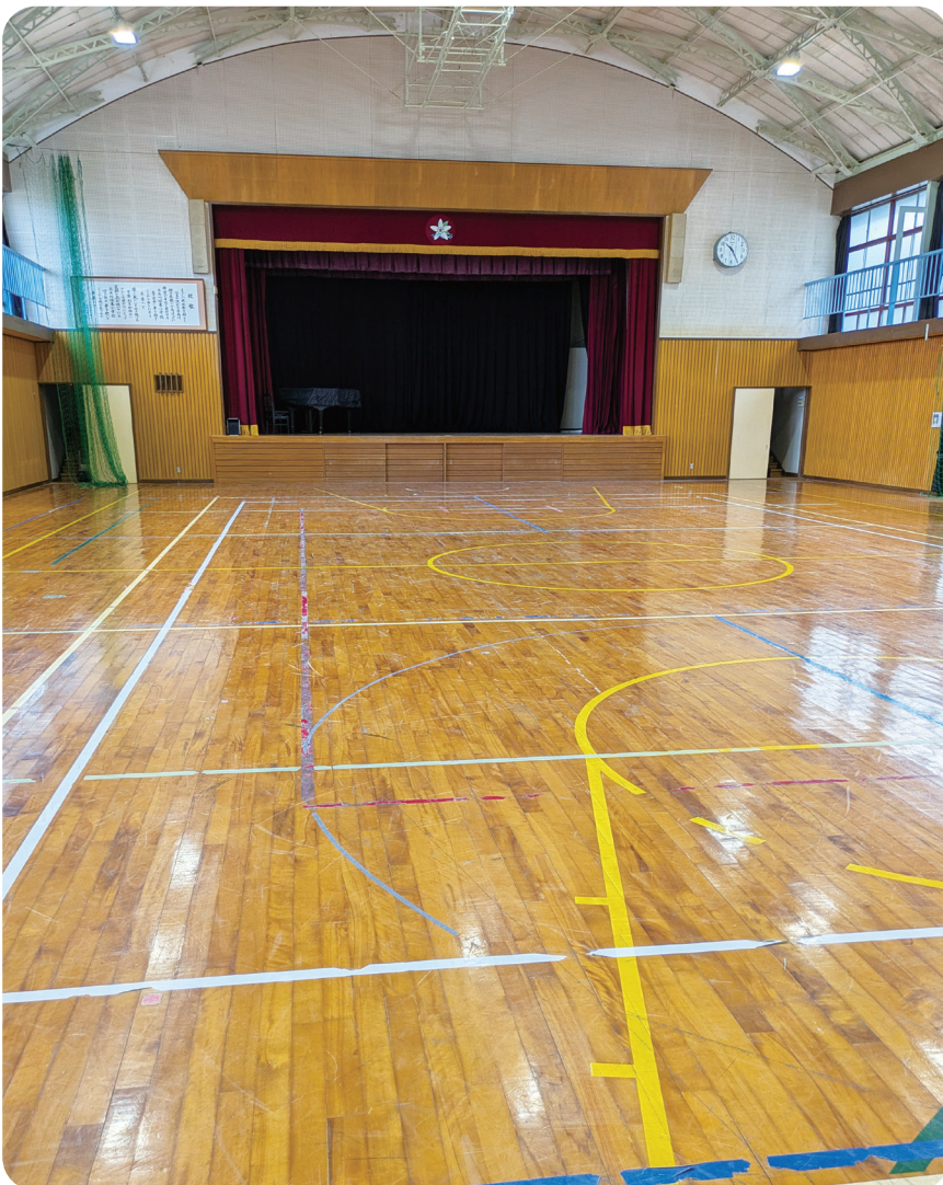
空調整備予定の学校体育館