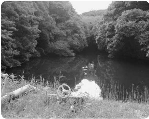
三百瀬地区の中西池