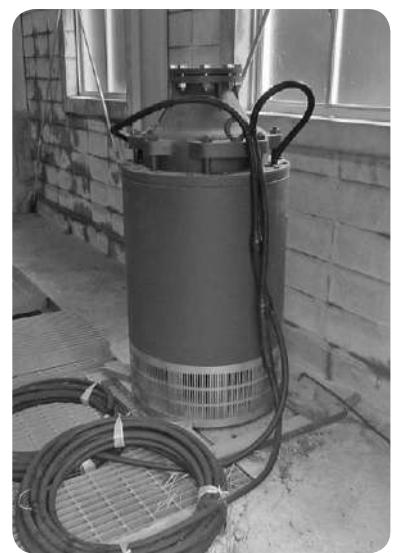
笠松農業用水の水中ポンプ

答 歳入に前年度繰越金を計上し、歳出に介護給付費準備基金積立金及び返還金を計上するものです。(賛成全員)