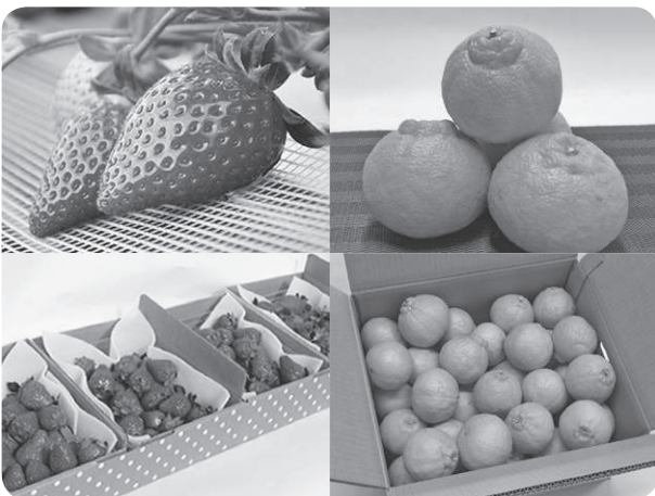
ふるさと納税返礼品の一部