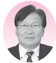
入口 誠 議員

ン記念イベントを予定し、当施設を広く県内外にPRする。今後も大会開催や合宿等の誘致を積極的に進めていく。