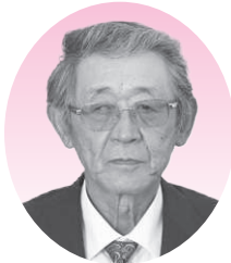
堀江 才二 議員

159万1千円の増額である。県下では30市町村中29番目であり、日高管内でも一番低い寄附額となっている。こういった状況を改善すべく、今年度からポータルサイトの見直しを実施し、共通返礼品を取り扱えるよう打合せも行っている。 また、10月から年末にかけて、寄附額がピークになる時期に合わせて5つのポータルサイトを新たに追加し、開設する。 地元返礼品を増やすことは大変重要であり、本町産の特産品の量を確保し、出品していただけよう努めている。人員の確保については、事業量等を勘案して今後検討していく。