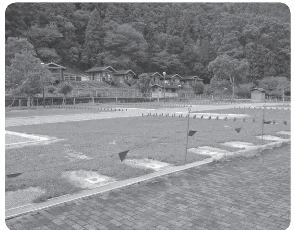
整備中のオートキャンプ場(高津尾地内)