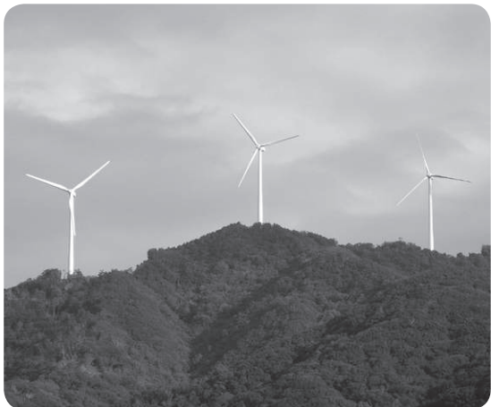
白馬林道沿いの風力発電施設

地所有者の税負担が大きくなるか。 答 現況風車が建っている土地は雑種地、事務所の建設地は宅地として課税している。雑種地は、山林より高いが面積が少ないため、税収に影響はない。