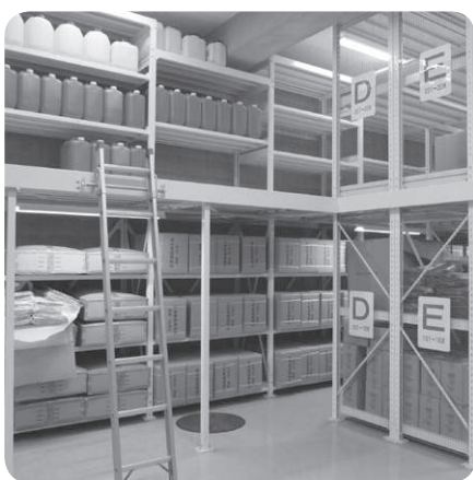
防災センターの備蓄倉庫

っている。 自治振興補助制度は、町が誕生し17年という中で、見直しも必要であり、検討したい。 非常食の備蓄は、救援物資が届くまでの間として3日分を想定し、全町民の3食分に当たるアルファ米約3万食と1日1人3リットルを基準として飲料水を3万リットルを目指している。 道路災害については、町建設業協同組合と協定を締結しており、速やかに通行できるように対応している。