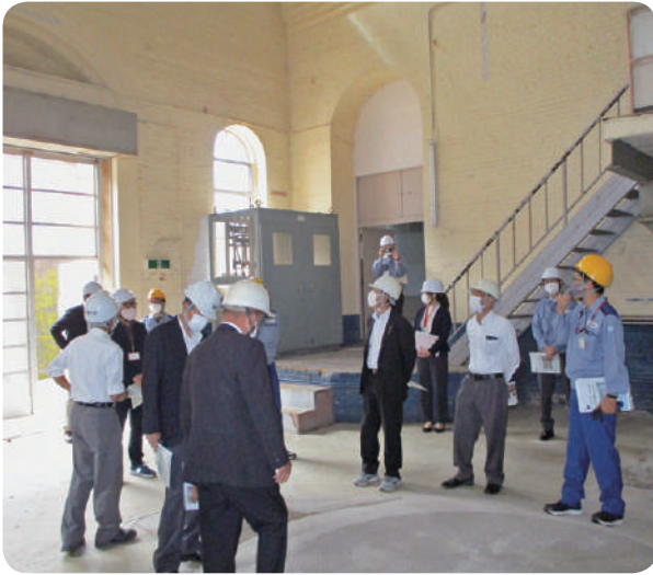
旧高津尾発電所内部