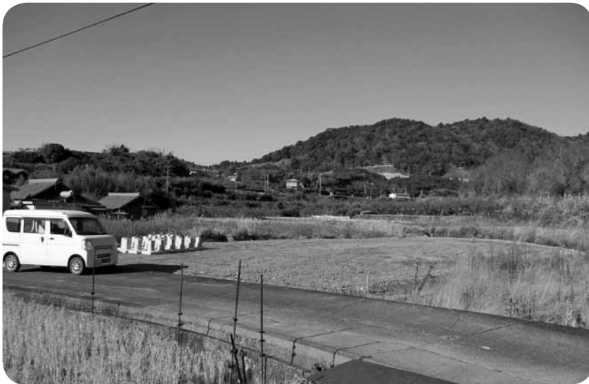
コーヒー豆施設栽培予定地(中津川地内)