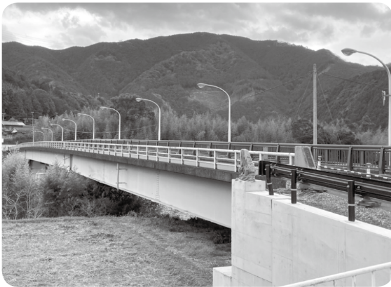
新田橋(高津尾地内)

答 避難所等の地域防災計画とのすり合わせはできているのか。 答 地域の皆さんに周知する。