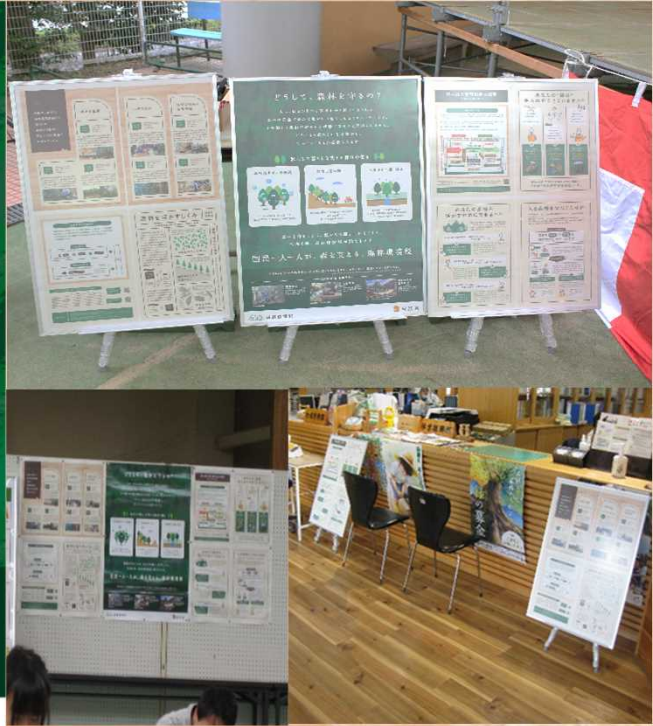
第7回フォレスト祭、庁舎執務室での展示