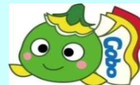
ハローワーク御坊マスコットキャラクター まめぴー