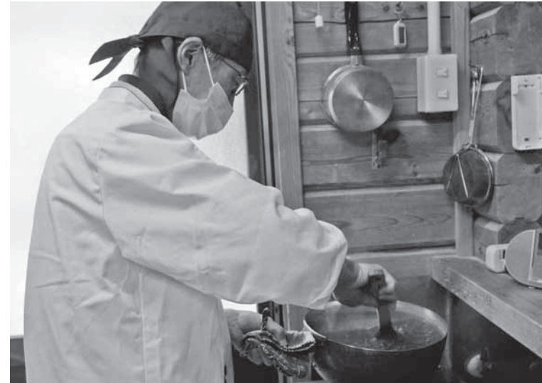
餡好きな安大さんの餡作り

パンを食べて欲しいという想いが昔からありました。現在はそれを学校給食として届けることができていますので、妻と一緒に「幸せやね」と話しています。