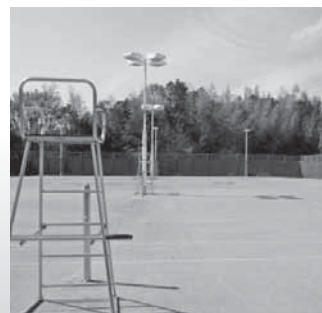
No.1, 2, 3番コート