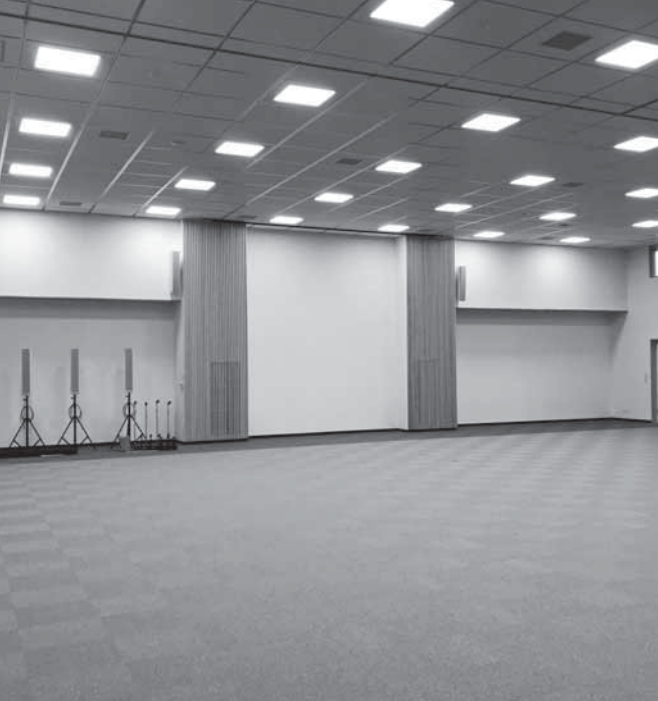
防災イベントスペース