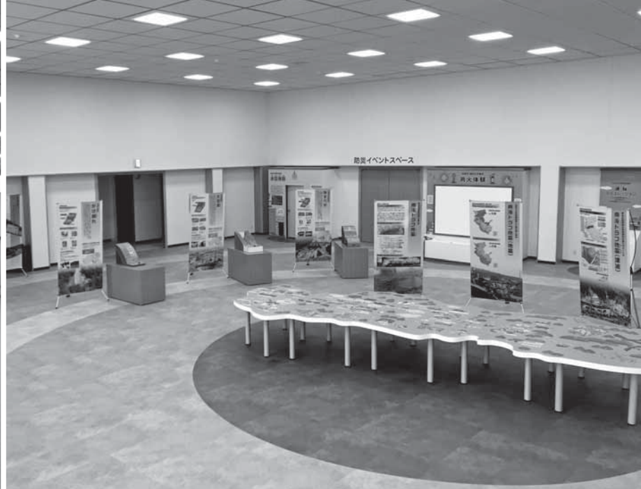
防災展示スペース