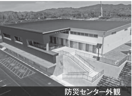
防災センター外観