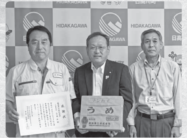
左：三ツ井代表取締役 右：高橋取締役