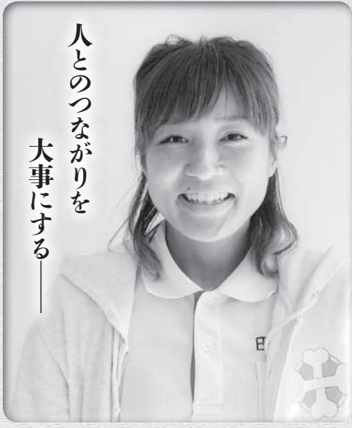
人とのつながりを 大事にする