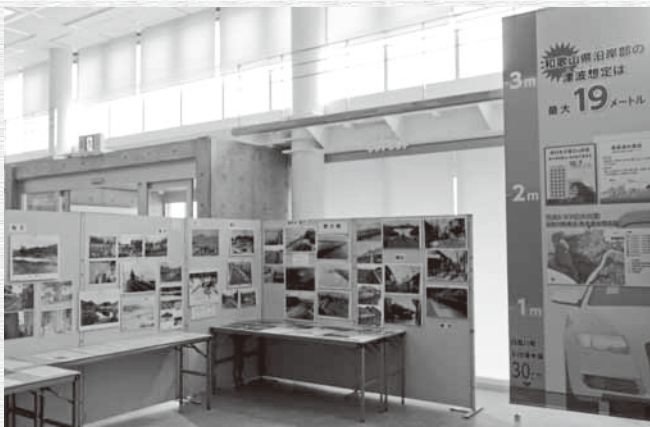
大水害の写真・手記の展示場

た。来年度、小学校に入学する児童の見込みが立っていないとの事で、子供の呼び込みのために地区が移住者の支援に乗り出した形です。こういった地区や団体といった比較的小規模での取り組みは、「地域おこし」において何より大事だと思っています。小規模での取り組みほど当事者としての問題意識が高く、目的も具体的だからです。僕は、「地域おこし協力隊」として、主に空き家関係の業務に携わらせて頂いておりますが、趣旨から外れていなければある程度は融通の効いた行動も許されている立場にあります。地区や団体単位での取組にも出来る範囲で協力させて頂きたいと思っていますので、お気軽にお声掛けください。