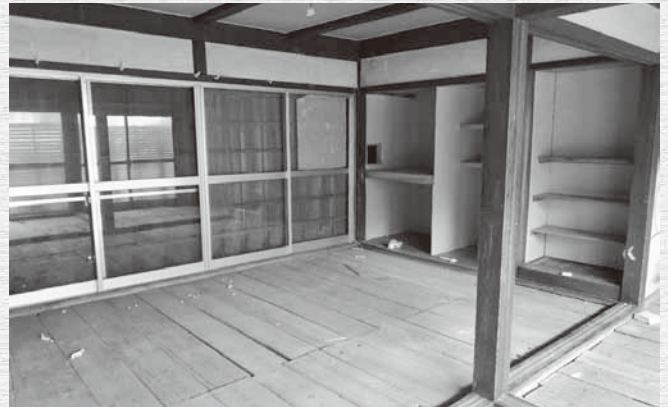
地区が提供する支援付き空き家

にとっては良い勉強になりました。さて、少し前の話ですが、空き家バンクへの登録に関する相談で印象的な案件がありました。大まかな内容としては、「地区が家主から空き家を購入し、ある程度リフォーム費用を負担するので、小学校に入学する子供を持つ移住者がいたら紹介して欲しい」というものでし