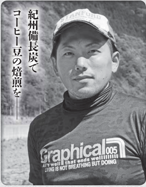
紀州備長炭で コーヒー豆の焙煎を