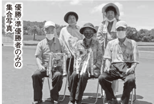
優勝・準優勝者のみの 集合写真

令和2年7月29日(水)に、南山スポーツ公園において、日高川町体育協会ペタンク、グラウンド・ゴルフ大会が行われました。ペタンクは15チーム40名、グラウンド・ゴルフは63名の参加があり、結果は次のとおりです。(敬称略)