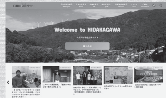
日高川JUガイド トップページ