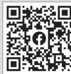
日高川移住受入協議会 Facebook

移住支援事業に関しては、僭越ながら私が日高川移住受入協議会の中心となって取り組んでいきます。協議会の具体的な取組としては、日高川町の日常や移住支援施策の紹介、空き家バンクの登録情報等の移住者を検討している方向けの情報発信、地元の方や先輩移住者のご紹介、交流会等のイベント企画です。現時点では、協議会のメンバーも少なくできることにも限りがありますが、メンバーが増える事によって活動内容の幅も広がっていき考えています。もしお力添えいただけるのであれば、会員としてご協力いただければと思います。よろしくお願いいたします。